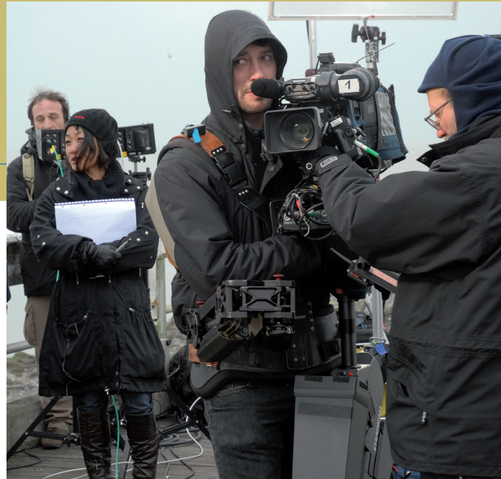
La RTBF en plein tournage à la côte belge: un travail d'équipe.