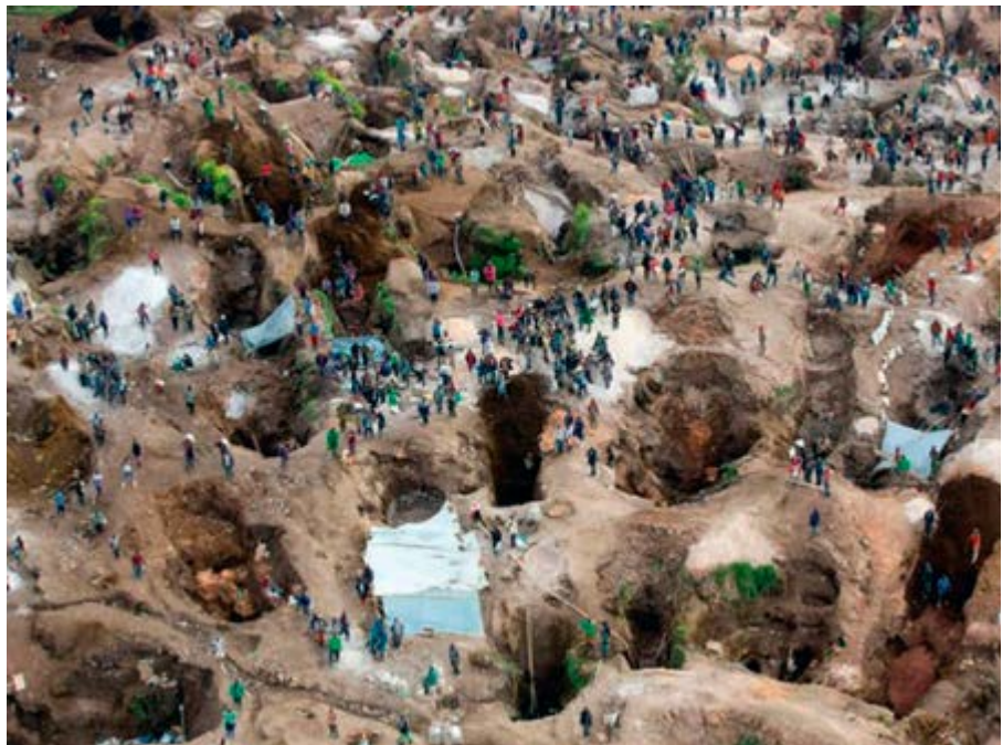
"Les minerais du Kivu", de Qution Noirfalisse, pour Le Vif, figure au nombre des reportages soutenus par le Fonds publiés en 2022.

Pour la première fois, depuis le lancement du Fonds pour le journalisme fin 2009, plus de 30 sujets sont publiés ou diffusés sur une année. C'est le cas pour 2022 où 35 sujets ont abouti, alors qu'auparavant entre 16 et 28 projets aboutissaient chaque année. Cela montre bien que le Fonds est entré dans son régime de croisière, qu'il a trouvé sa "clientèle" (journalistes et médias, et, surtout, qu'il montre son utilité. Car les sujets sont de qualité, intéressants, fouillés... De belles enquêtes, de grands reportages. Une réelle plus-value pour la presse de la Fédération Wallonie-Bruxelles. Plutôt que de tenir de grands discours, nous vous proposons de découvrir ces 35 sujets, en mentionnant le ou les